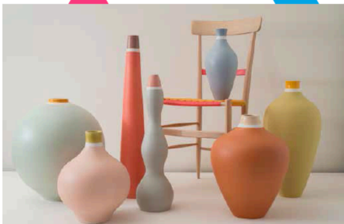
Matteo Thun Atelier: Ceramics 建筑师Matteo Thun在2016年的米兰设计周上推出了首个主打纯手工制作的自有家具品牌系列，有多达13种的配色定制。