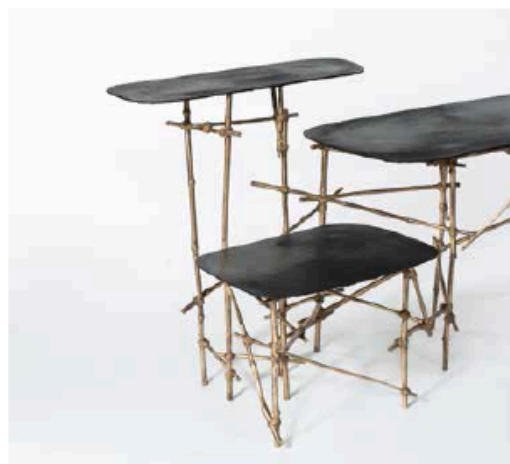
Alvaro Diaz Hernández: Linea Magazine Holder 一款极具视觉张力的杂志架，下部椅子形状的空间可用于堆放杂物和书籍，上方的金属框可作手操作，能将正在阅读的杂志吊在上面，结构轻盈却牢固坚韧。