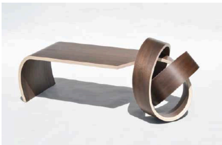
Kino Guérin: Why Knot Table 加拿大设计师德雷·斯勒设计的超酷桌Why Knot Table把夹板木板压弯、缠绕，打了个结作为桌腿，颠覆了传统造型，带一点陈有意味的雕塑感。